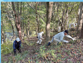
福岡市水源林ボランティア