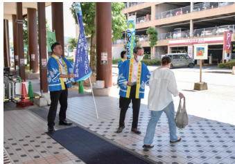
大野城市 (イオン大野城ショッピングセンター)