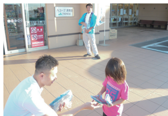
須恵町 (トレードマート須恵店、Aコープ須恵店)