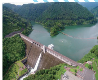
大山ダム（大分県日田市）