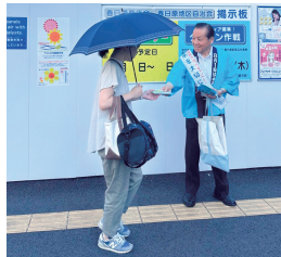
春日市・春日那珂川水道企業団 (西鉄春日原駅、JR春日駅)