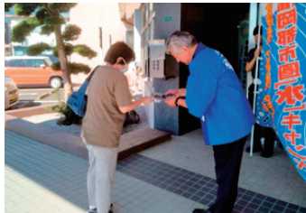
宇美町 (宇美町役場)