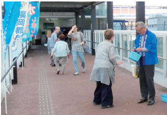
那珂川市・春日那珂川水道企業団 (JR博多南駅)