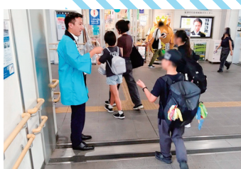
福津市・宗像地区事務組合 (JR福岡駅)