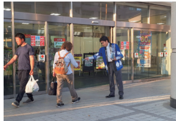
古賀市 (サンリブ古賀店)