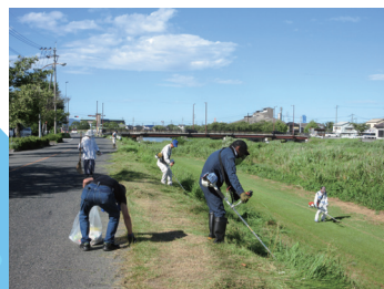
甘木町「小石原川を守る会」