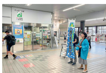
宗像市・宗像地区事務組合 (JR赤間駅)