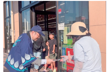
太宰府市 (ルミエール太宰府店、西鉄都府楼前駅)