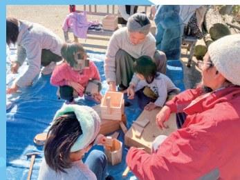
里山保全の会 東峰フラワーズ