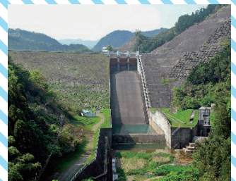
合所ダム（福岡県うきは市）