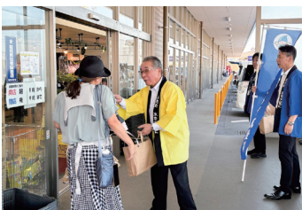
志免町 (ルミエール志免店)