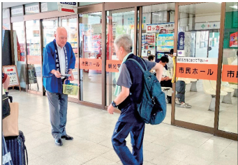
筑紫野市・山神水道企業団 (JR二日市駅東口)