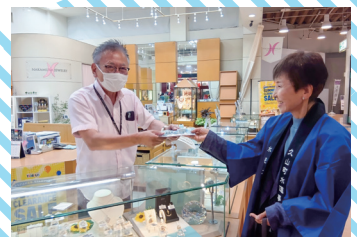
久山町 (トリアスタ山)