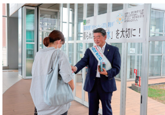
新宮町 (JR新宮中央駅)