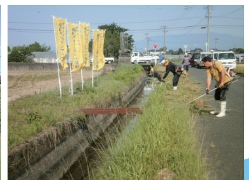
堀川の環境を守る会